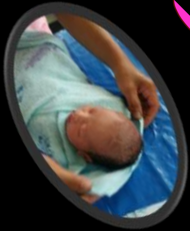
กลุ่มที่2 มารดาหลังคลอด

2.5 นำไปใช้กับกลุ่มเป้าหมาย (3)ระยะเวลาดำเนินการ เมษายน - มิถุนายน 2566