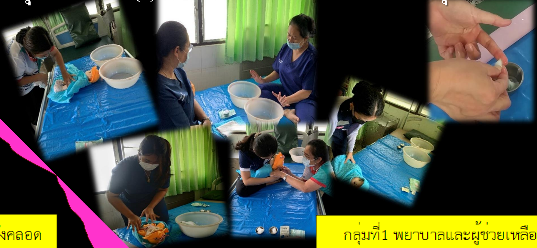
กลุ่มที่1 พยาบาลและผู้ช่วยเหลือคนไข้